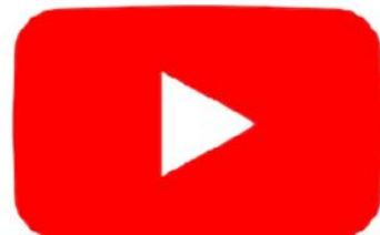
SCGP Sociedad de Cirujanos Generales