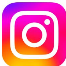
Sociedad Cirujanos Perú