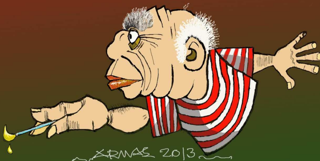
Pablo Ruiz Picasso (1881-1973)

Fue un incansable y prolífico pintor español: pintó más de dos mil obras que se encuentran en museos de todo el mundo, pero también abordó otros géneros como dibujo, grabado, ilustración de libros, escultura, diseño de escenografía y vestuario para obras teatrales y fue uno de los creadores del movimiento cubista.