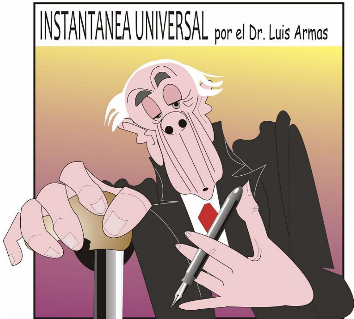
Jorge Luis Borges (1899-1986)

"Prolífico escritor argentino, autor de numerosísimos ensayos, cuentos y poemas."