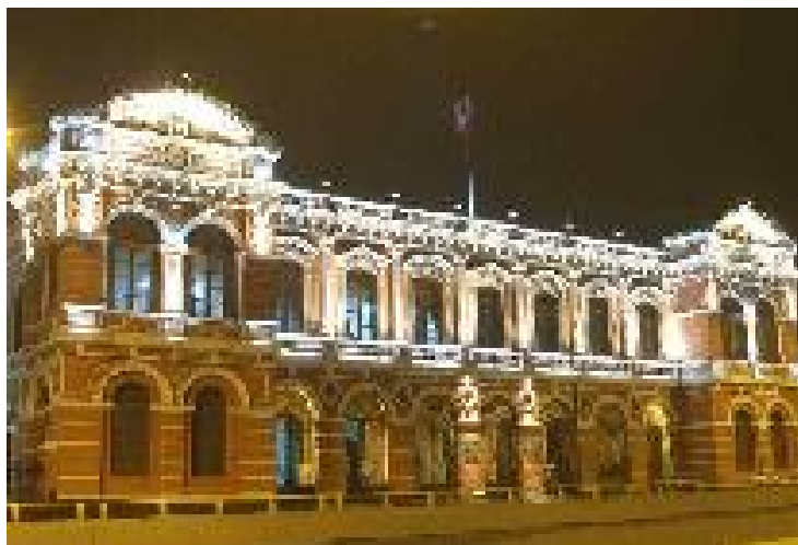
Frontis de la Facultad de Medicina de San Fernando

En esta forma, la Facultad de Medicina de San Fernando logró superar la crisis más grave de toda su vida institucional, retornando a los fines primordiales de docencia e investigación con la participación de profesores, alumnos y estamento administrativo, conformando su calidad histórica académica y científica, iniciada por Hipólito Unanue y continuada por Cayetano Heredia.