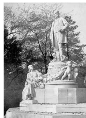
Monumento a Semmelweis Hospital de Budapest.

Semmelweis comunica su descubrimiento en un brillante trabajo, lleno de tablas en las que cruza datos de infección, lavado de manos, defunciones y partos. Pero se topa con el rechazo de los más brillantes cirujanos de la época, que no quieren admitir algo tan simple. Le echan en cara que no sigue ningún método científico, que sus estudios no son reproducibles y que se ha inventado los datos del trabajo. El propio Klein, herido en su