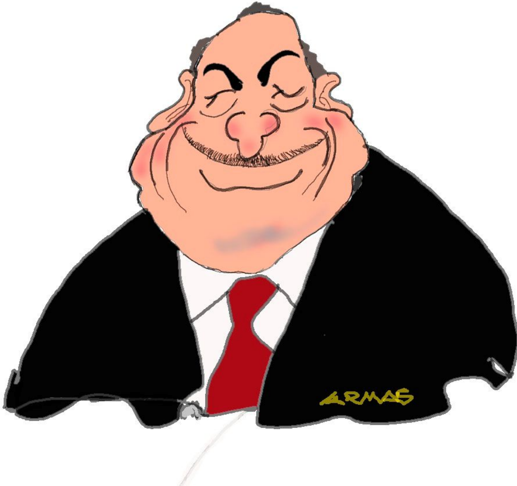
Carlos Slim Helú. (México 1940)

Es un ingeniero, empresario mexicano y el quinto hombre más rico del mundo pues posee una fortuna de casi 70 mil millones de dólares. Él fue quien donó una importante cantidad de motobombas al Perú con ocasión del fenómeno del Niño costero que causó tanto daño a la población peruana.