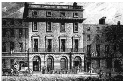
Freemasons Tavern (1863)

Morley convocó a un grupo de representantes de una docena de equipos londinenses (tanto directivos como jugadores). Los asistentes decidieron crear una asociación, la conocida como FA (Football Association), que estableciera un conjunto de reglas comunes para todos los jugadores y equipos practicantes del balompié en Inglaterra. Morley, designado secretario de la recién creada FA, redactó un reglamento que fue aprobado por la asociación y