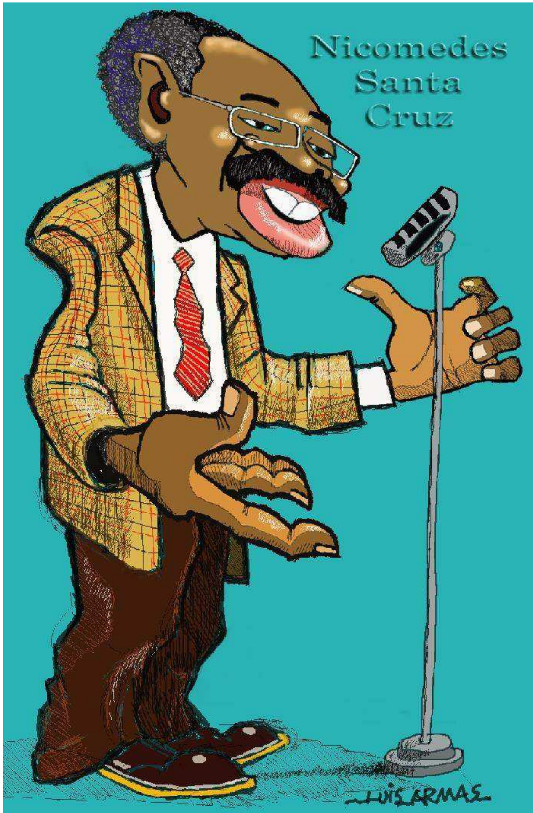
Nicomedes Santa Cruz Gamarra (1925-1992)

Eximio decimista peruano de "pie forzado" que llevó la cultura peruana a distintos lugares del mundo. Sus más famosas: "Cómo has cambiado pelona", "A cocachos aprendí", etc.