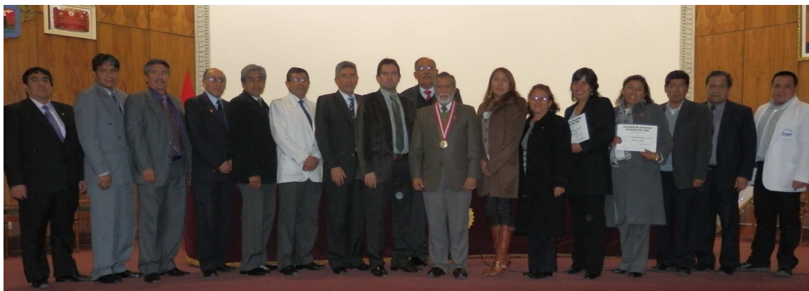
Incorporación de Cirujanos Arequipeños