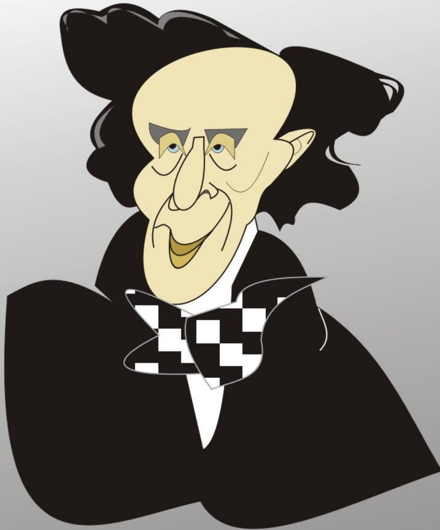
Hans Christian Andersen

Escritor y poeta danés, famoso por sus cuentos para niños: “El patito feo”, “La caperucita roja”, etc”.