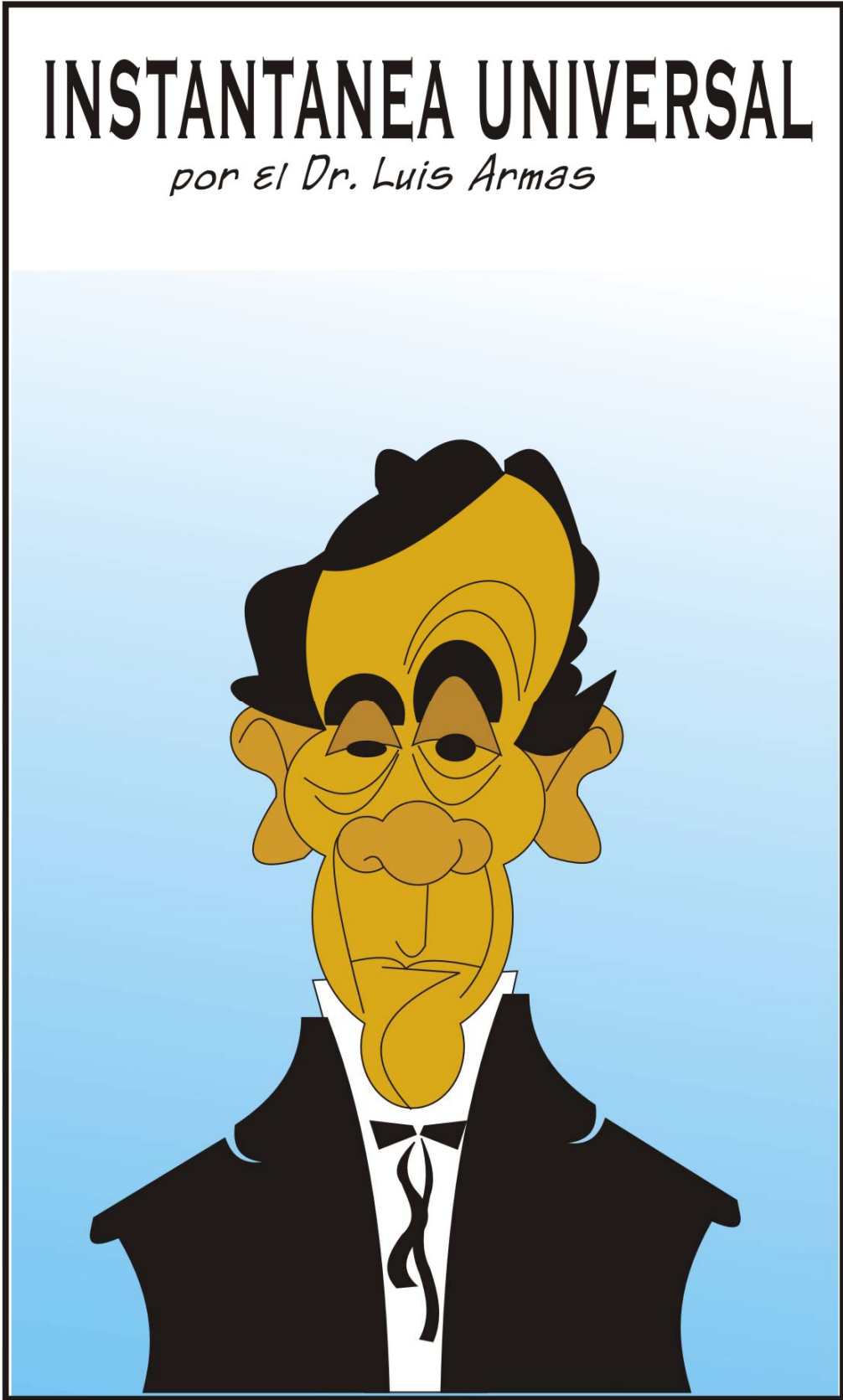
José Bernardo Alcedo, (1788-1878)

Músico limeño, fue el compositor de la música del Himno Nacional peruano, convocado por el mismo General San Martín.