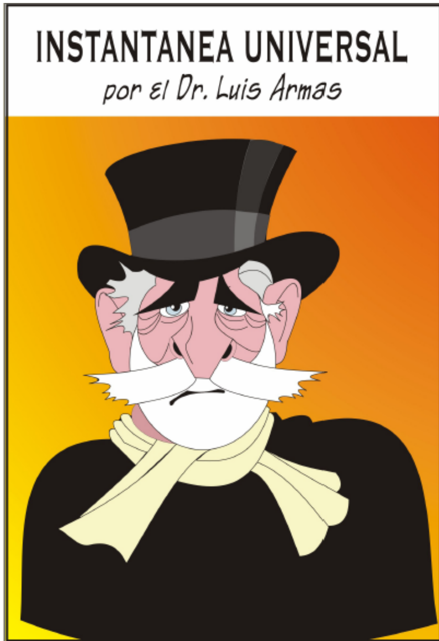
GIUSEPPE VERDI (1813-1901), Compositor romántico italiano, autor de Rigoletto, La Traviata, In Trovatore, Aida.