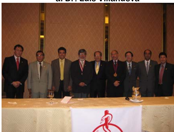
Junta Directiva 2007-2009