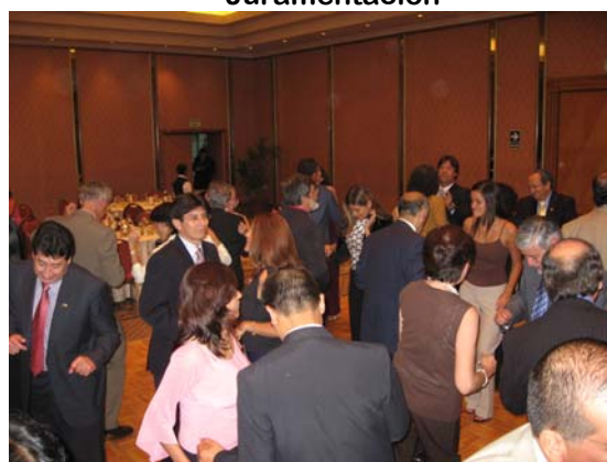
En plena pista de baile

Además puedes observar algunos pequeños videos sobre nuestra fiesta, donde apreciaras la alegría y camaradería, así mismo la demostración de cómo se bailan algunos de nuestros bailes típicos: huayno, marinera y negroide. Ingresa a www.youtube.com , en search coloca: SCGP o Cirujanos Peru, podrás escoger los videos que deseas visualizar. Identifica a los cirujanos protagonistas!