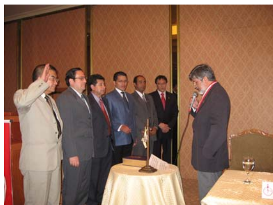
Juramentación de la Junta Directiva