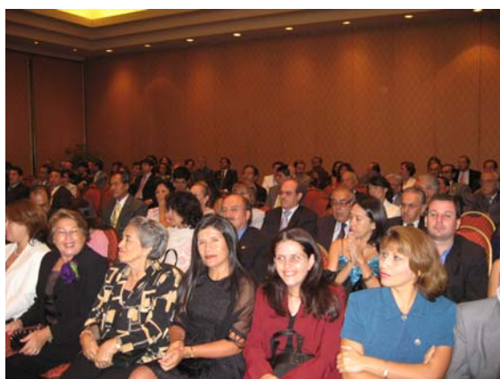
Auditorio en ceremonia de Juramentación