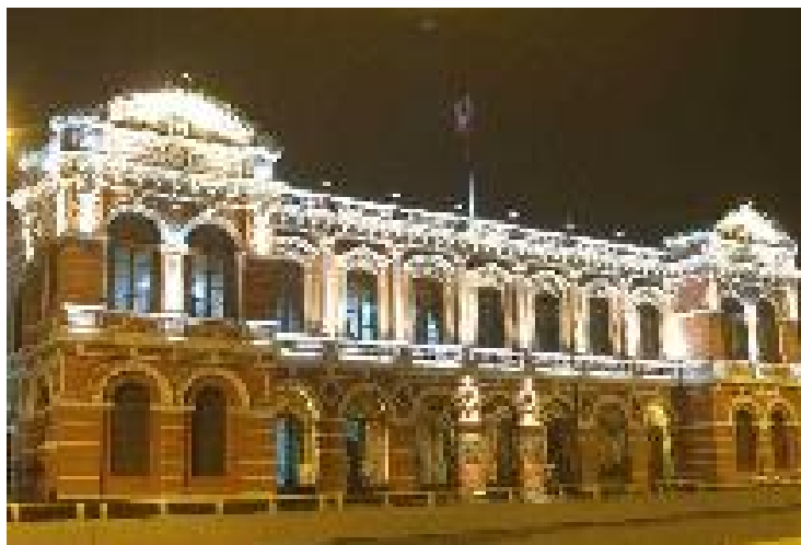
Frontis de la Facultad de Medicina de San Fernando

En esta forma, la Facultad de Medicina de San Fernando logró superar la crisis más grave de toda su vida institucional, retornando a los fines primordiales de docencia e investigación con la participación de profesores, alumnos y estamento administrativo, conformando su calidad histórica académica y científica, iniciada por Hipólito Unanue y continuada por Cayetano Heredia.